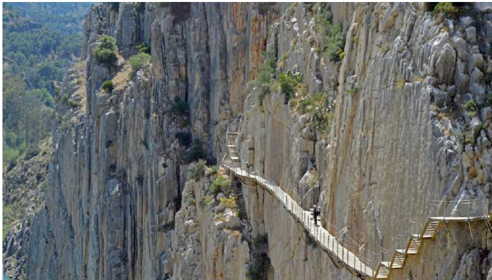
Caminito del Rey