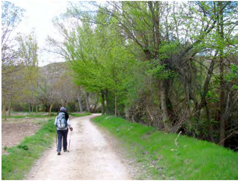
ESTRECHOS del EBRÓN